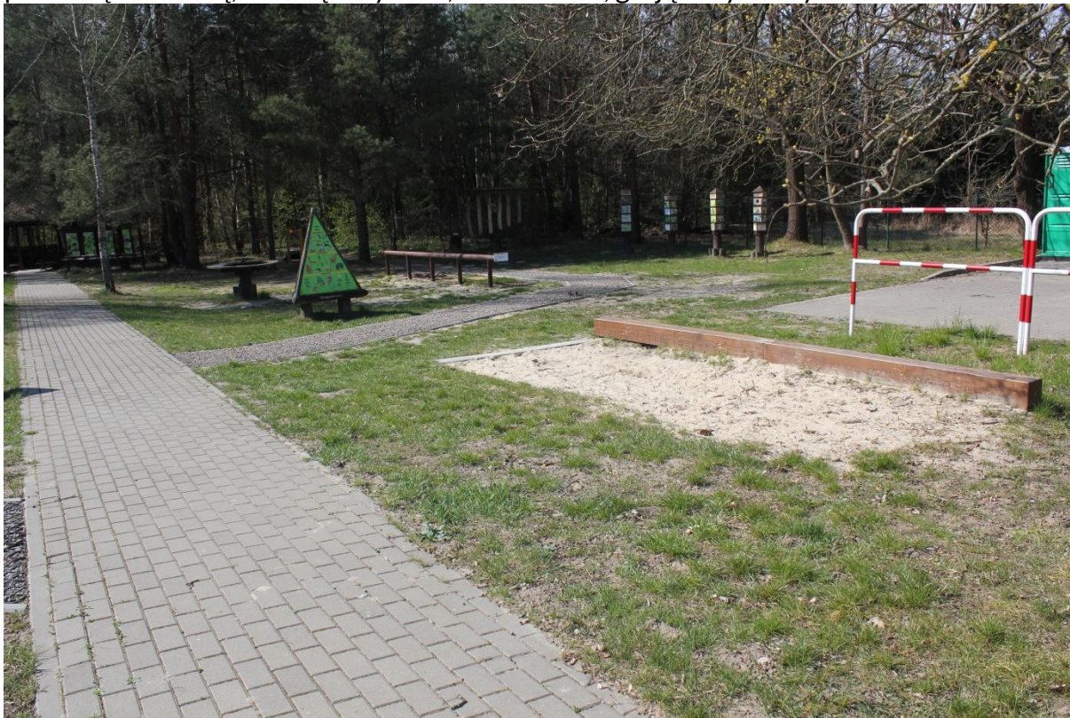
Interaktywne urządzenia edukacyjne na przyrodniczym placu zabaw na terenie ODM PPN w Starym Załuczu.

Wybierając chodnik po prawej stronie, kierujemy się na dalszą trasę ścieżki. Po prawej stronie chodnika mijamy edukacyjny plac zabaw wyposażony w: skocznię, piramidę troficzną, ścieżkę zmysłów, koło wodne, grające cymbały i mostek.