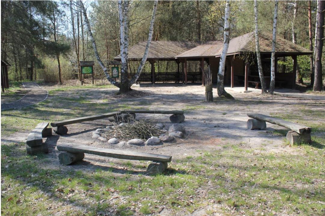
Zadaszenie turystyczne na terenie ODM PPN w Starym Załuczu wraz z miejscem na ognisko.

Dalsza część ścieżki prowadzi nas do zadaszania turystycznego z miejscem na ognisko.