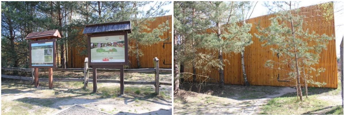
Lotnia dla ptaków.

Nasz spacer dobiega końca. Mijamy oczyszczalnię ścieków z drugiej strony (oczyszczalnia widoczna z prawej strony, kierując się w stronę budynku Muzeum i wyjścia z Ośrodka). Ponownie docieramy do rozwidlenia chodnika, gdzie znajduje się duży model żółwia błotnego. Tutaj ścieżka zamyka się w pętlę.