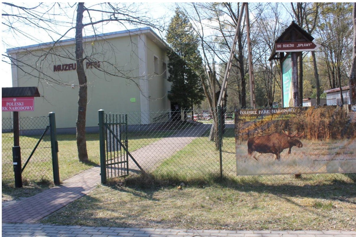
Ośrodek Dydaktyczno Muzealny Poleskiego Parku Narodowego w Starym Załuczu.

Na terenie ODM PPN w Starym Załuczu znajdują się: