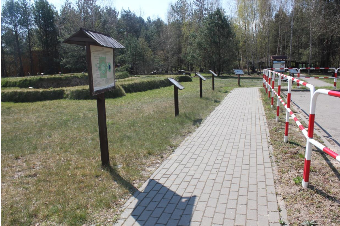
Chodnik w kierunku ścieżki. Po lewej stronie widoczne tablice i oczyszczalnia ścieków w kształcie żółwia.

Poruszając się chodnikiem w kierunku ścieżki, zaraz po lewej stronie mijamy Hybrydowo-hydrofitową oczyszczalnię ścieków, wykonaną w kształcie żółwia . Zastosowany hybrydowy system gruntowo – roślinny z pionowym i poziomym przepływem ścieków, zapewnia skuteczne oczyszczanie ścieków bytowych pochodzących od pracowników Ośrodka Dydaktyczno – Muzealnego oraz turystów i jednocześnie ochronę wód podziemnych.