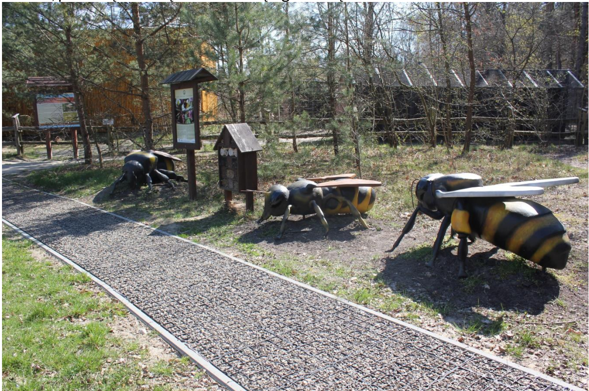
Duże modele owadów zapylających; trzmiel, pszczoła miodna, murarka ogrodowa (fot. Anna Myka-Raduj).

Idąc dalej w kierunku wolier, na niewielkiej łące po prawej strony chodnika, mijamy hotel dla owadów zapylających (domek dla owadów), tablicę informacyjną oraz 3 duże modele owadów zapylających (ok. 1m długości każdy), przedstawiające: trzmiela, pszczołę miodną oraz murarkę ogrodową.