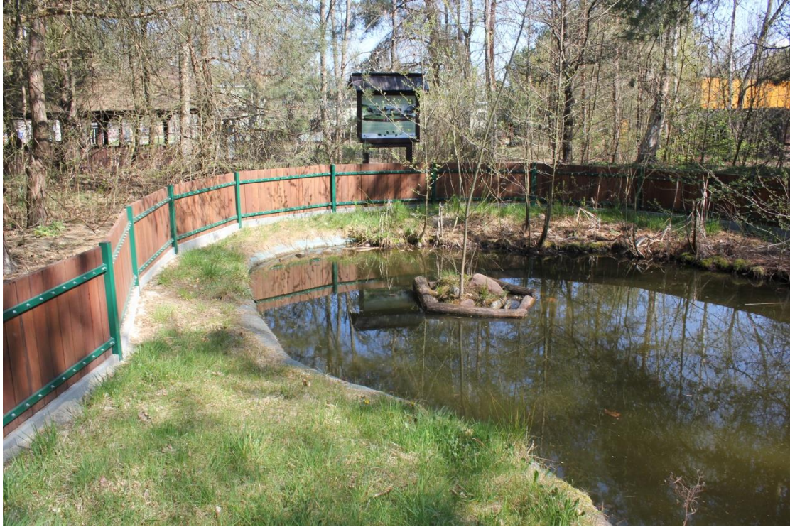
Oczko wodne.

Następnie docieramy do centralnej części ścieżki, gdzie znajduje się oczko wodne, w którym można spotkać żółwie błotne. Brzeg oczka porasta niewielki płat splei (pło) z charakterystyczną roślinnością, którą tworzą między innymi: rosiczka okrągłolistna, żurawina błotna, wełninka pochwowata, modrzewnica zwyczajna, turzycza bagienna i wierzba lapońska. Tutaj poznajemy cykl życia żółwia błotnego.