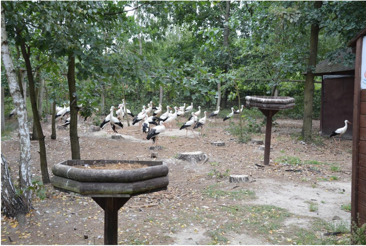
Bociany białe w woliere.

Dalej idąc chodnikiem mijamy po prawej stronie, w bezpiecznej odległości dla zwierząt, woliery dla małych ptaków, dużą otwartą woliere dla bocianów, woliere zamkniętą głównie dla ptaków drapieżnych i sów, a nieco dalej obszerną lotnię dla skrzydlatych podopiecznych Ośrodka Rehabilitacji.