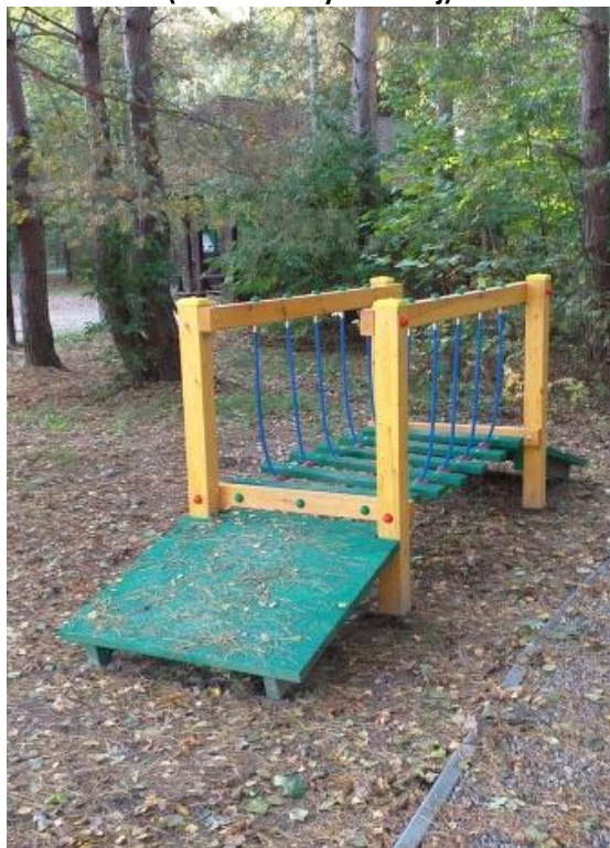
Skocznia na przyrodniczym placu zabaw.