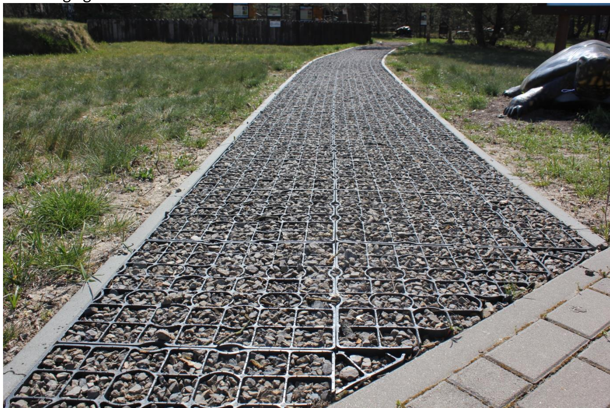
Chodniki z geotermy, umożliwiające poruszanie się po ścieżce „Żółwik” na terenie ODM PPN w Starym Załuczu, osób z niepełnosprawnością ruchową, rodzin z dziećmi na wózkach i rowerzystów.

Ze względu na niedługą i stosunkowo łatwą do pokonania trasę, wyznaczoną po przez specjalnie przygotowane chodniki z geotermy, umożliwiające poruszanie się osób z niepełnosprawnością ruchową, rodzin z dziećmi na wózkach, przeznaczona jest dla szerokiego grona odbiorców.