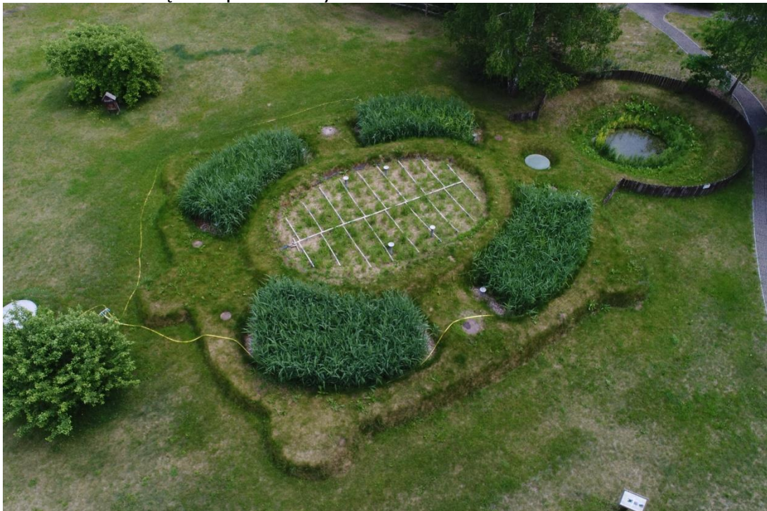
Hybrydowo-hydrofitowa oczyszczalnia ścieków w kształcie żółwia, na terenie ODM PPN w Starym Załuczu widok z góry.

Poruszając się chodnikiem w kierunku ścieżki, zaraz po lewej stronie mijamy Hybrydowo-hydrofitową oczyszczalnię ścieków, wykonaną w kształcie żółwia . Zastosowany hybrydowy system gruntowo – roślinny z pionowym i poziomym przepływem ścieków, zapewnia skuteczne oczyszczanie ścieków bytowych pochodzących od pracowników Ośrodka Dydaktyczno – Muzealnego oraz turystów i jednocześnie ochronę wód podziemnych.