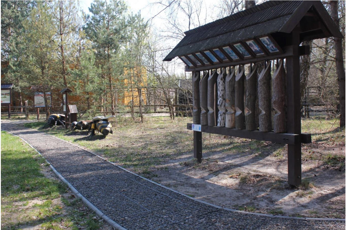
Interaktywna gabłota z pniami drzew (fot. Anna Myka-Raduj).

Idąc dalej w kierunku wolier, na niewielkiej łące po prawej strony chodnika, mijamy hotel dla owadów zapylających (domek dla owadów), tablicę informacyjną oraz 3 duże modele owadów zapylających (ok. 1m długości każdy), przedstawiające: trzmiela, pszczołę miodną oraz murarkę ogrodową.