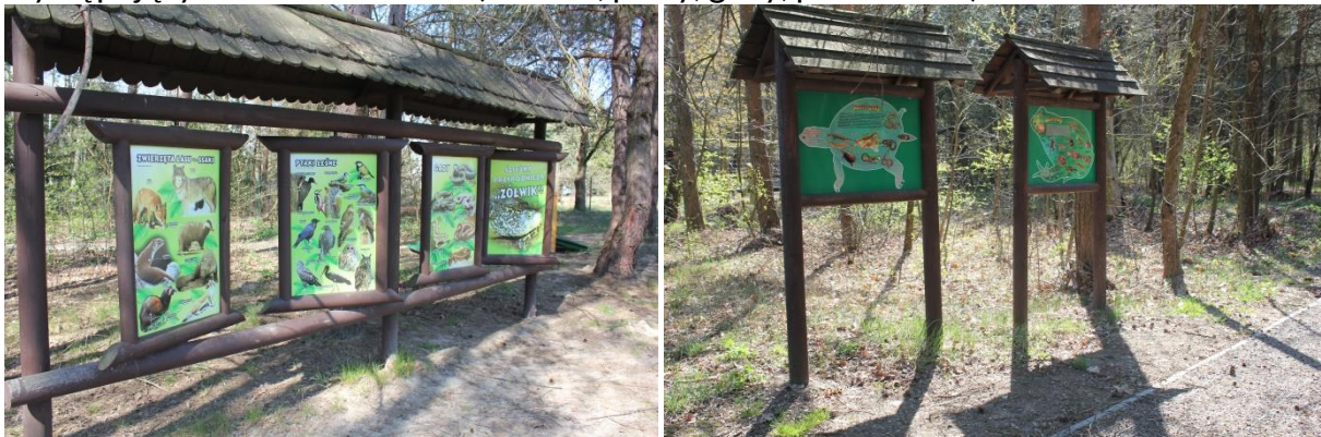
Tablice interaktywne - obrotowe i inne o ciekawej grafice i różnych kształtach.

Wokół zadaszania ustawione są tablice interaktywne (obrotowe i inne o ciekawej grafice i różnych kształtach), zawierające informacje o roślinach i zwierzętach występujących na terenie PPN (drzewa, płazy, gady, ptaki i ssaki).