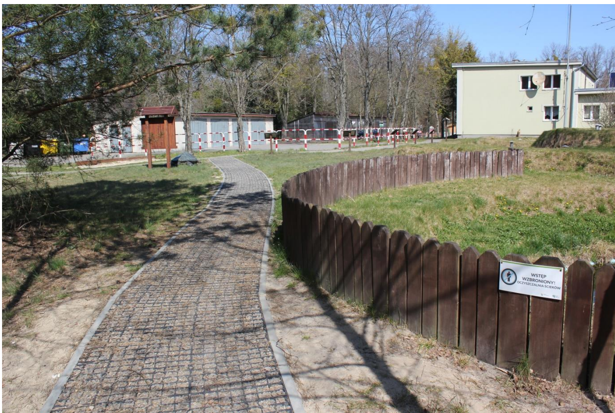
Oczyszczalnia ścieków od strony „Odbiornika ścieków oczyszczonych – Stawu” (fot. Anna Myka-Raduj).

Nasz spacer po ścieżce „Żółwik” już się kończy, ale przygoda z przyrodą nie. Przy mapie Poleskiego Parku Narodowego, ustawionej przy wyjściu z ośrodka, możemy planować kolejną ciekawą wyprawę.