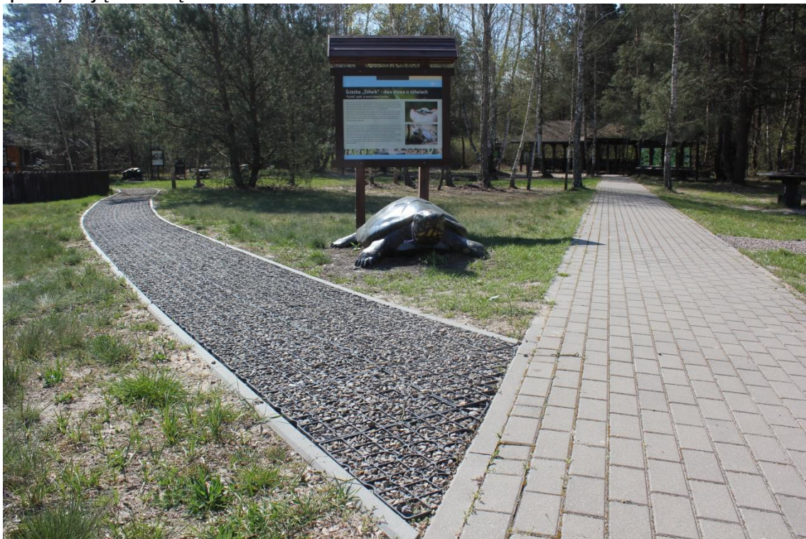
Początek ścieżki „Żółwik” na terenie ODM PPN w Starym Załuczu (fot. Anna Myka-Raduj).

Idąc dalej chodnikiem po trasie ścieżki, chodnik rozgałęzia się na dwie strony. W rozgałęzieniu ustawione są: duży model żółwia błotnego (ok. 2m długości) i tablica rozpoczynająca trasę ścieżki 'Żółwik'.