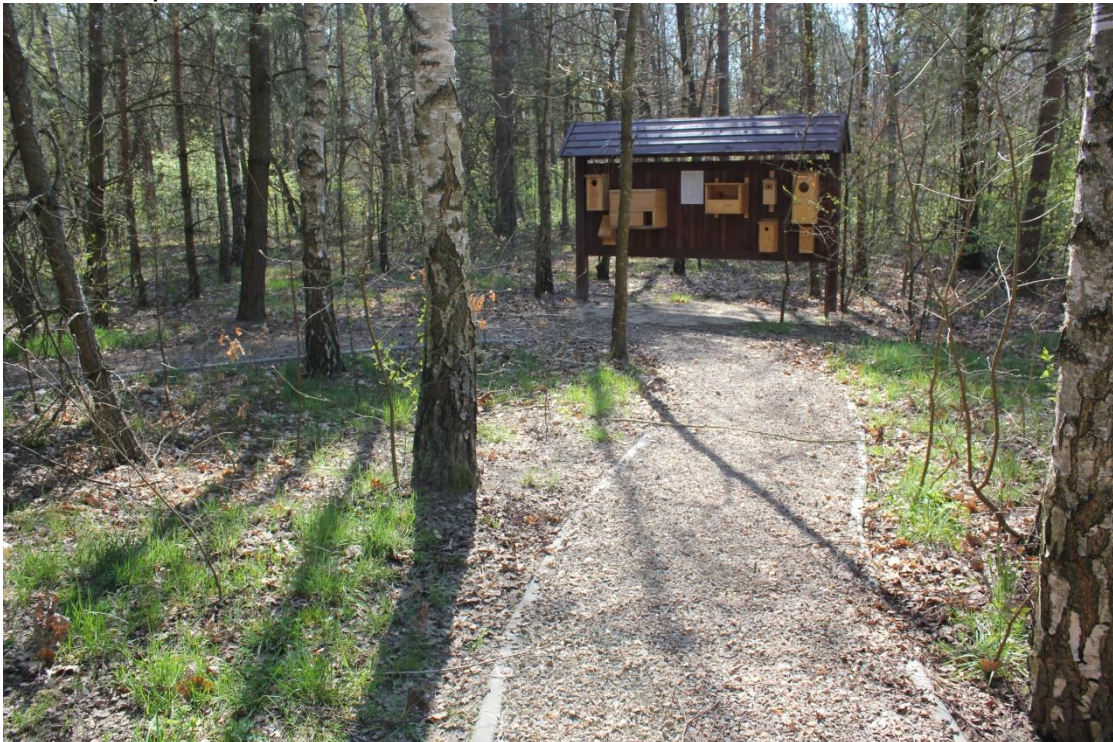
Tablica z budkami ptaków na trasie ścieżki „Żółwik”.

Dalej trasa ścieżki prowadzi nas wśród drzew, gdzie poznajemy strukturę i budowę lasu, różne gatunki drzew i zwierzęta w nim żyjące. Ustawiona jest tutaj tablica z budkami dla ptaków.